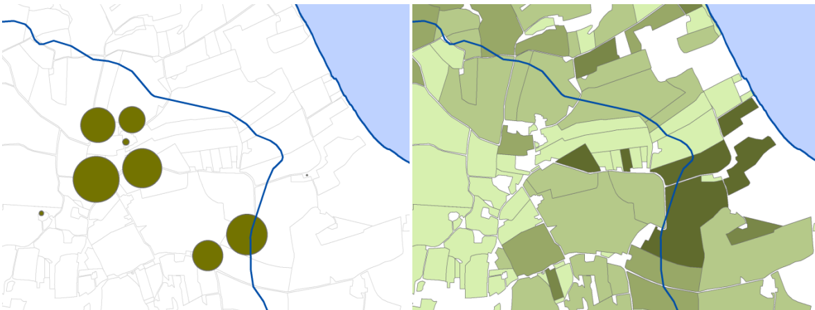
Figur 2. De to figurerer viser et udsnit af afgrænsningen mellem to mindre oplande. Figur 2a (til venstre) viser husdyrproduktionen opgjort på CHR-adressen, mens Figur 2b (til højre) viser variationen i udbragt husdyrgødning fra gødningsregnskabet fordelt på bedriftenes GLR-areal (mørke farver har størst husdyrtryk).

I vejledningen anføres det videre, at der: "i det visse tilfælde vil være nødvendigt med supplerende vurderinger, eksempelvis vedr. til- og fraført husdyrgødning i forhold til enkelte opland". Herudover anføres nødvendigheden for at vurdere "øvrige kilder" til nitratudvaskning. Yderligere vurderinger vil typisk være knyttet mindre oplande, hvor import og eksport af husdyrgødning ikke nødvendigvis balancerer og/eller hvor anvendelsen af f.eks. afgasset biomasse og anden organisk gødning kan være af betydning. Sådanne vurderinger vil kunne gennemføres ved koblinger mellem gødningsregnskaberne og oplysninger om udbringningsarealer fra GLR (se eksempelvis Figur 2b).